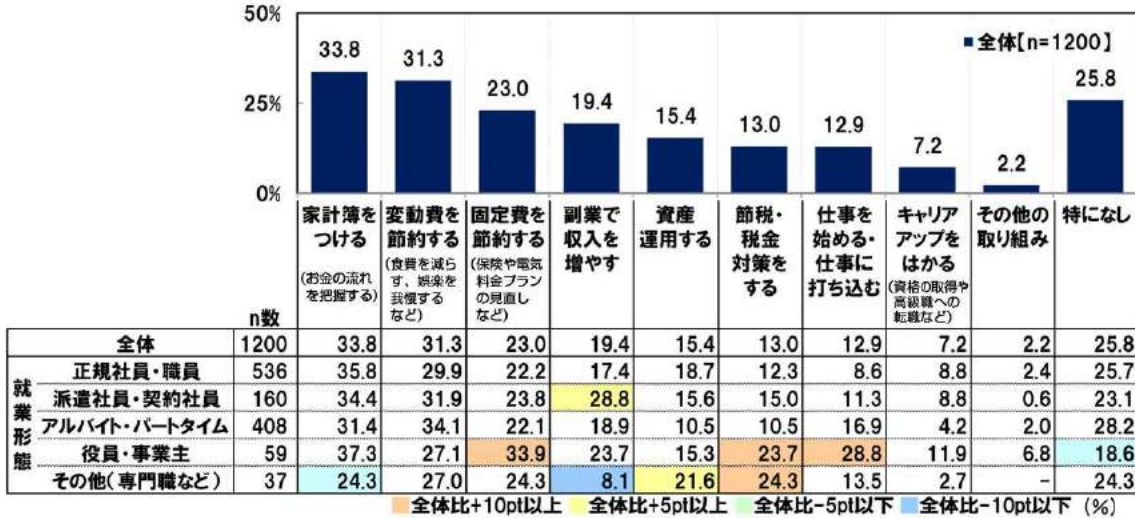
◆生活の余裕や貯蓄を増やすために行っていること [複数回答可]