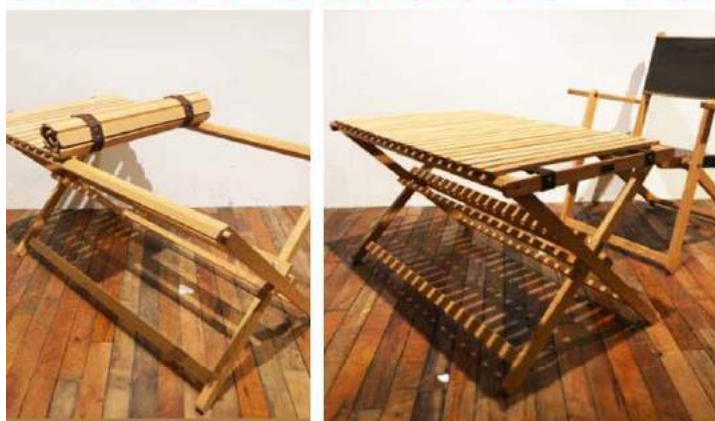
「INOUT (イナウト) クロステーブル」 ¥46,500 (税別)

おしゃれキャンパーからの支持が厚いブランド「INOUT」INOUTの製品はお部屋に置いても、フィールドのグリーンにも映えるよう、色合いやこだわり素材で作られています。ナチュラルな風合いで、使いながら“そだてる”家具。