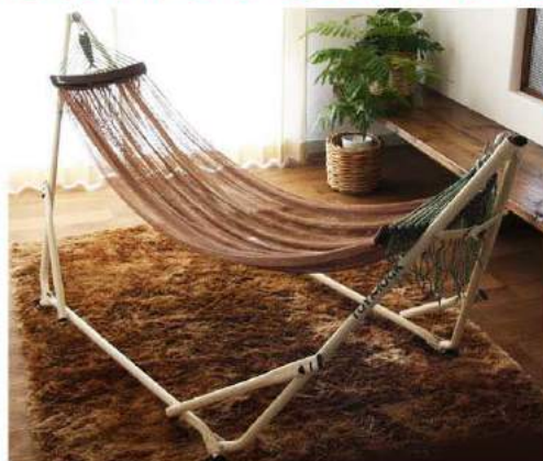
「トイモック」 対応身長180cmまで ¥7,000~¥20,000

トイモックは、室内でもアウトドアでも使えるスタンド付きハンモックです。80~100kgの荷重まで耐えることができ、重さは8.5~10kgありますが女性でも持ち運びしやすい肩掛け収納バッグに入っています。