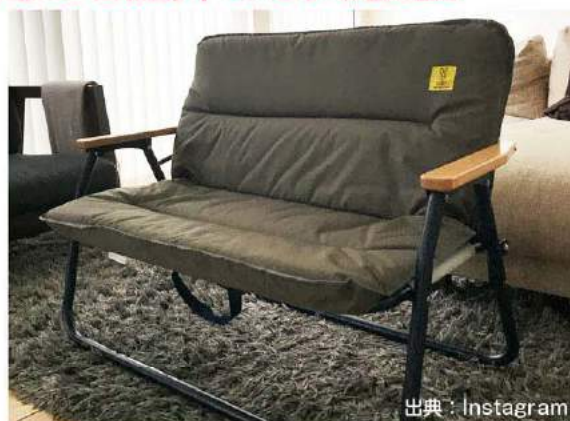
「ワンハンドキャリーソファ」 ¥12,300~

こう見えて折りたたみができ、軽量コンパクト。いつでも清潔に使えるウォッシュブルで、暑い時にはクッションカバーを外して使用できるクールモード、アームレストはナチュラルな木製。