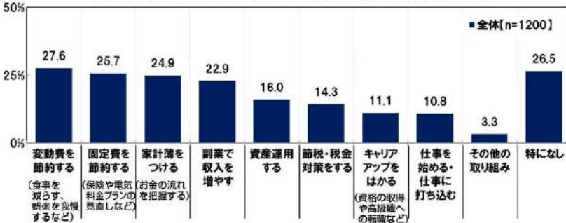
◆これから(引き続き/新しく/今以上に)取り組みたいこと [複数回答可]