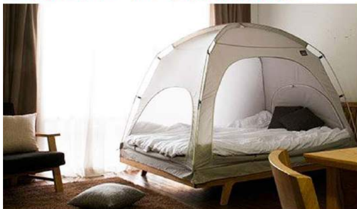
「タスマ暖房テント」 1~2人用210x120x135 ¥11,000前後~

キャンプに行けないけど雰囲気味わいたい人にぴったり。「暖房テント」の名の通り、冬の室内でポイント保温に使える事を売りにしていますが、夏はエアコンの風が直接肌に当たって冷えすぎるのを避ける使い方も好評。